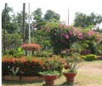
Figures 42 et 43 École de Kampong Chnnang et dortoir, et Cuisine, 2018