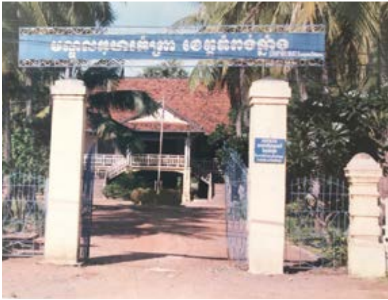
Figure 6 Kompong Chnang, bâtiment restauré en 2003

D'autres programmes apparaissent aussi : Aide aux Enfants de la Rue, aux enfants vivant dans leurs familles (les filleuls externes ), Aide aux jeunes plus âgés qui sont orientés vers une formation professionnelle, et déjà est évoquée la nécessité d'offrir aux enfants un soutien scolaire et de les ouvrir à l'étude du français (demande de nos responsables d'alors, largement francophones), et plus tard de l'anglais.