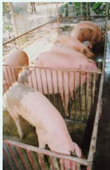
Figures 24 et 25 Élevage des cochons