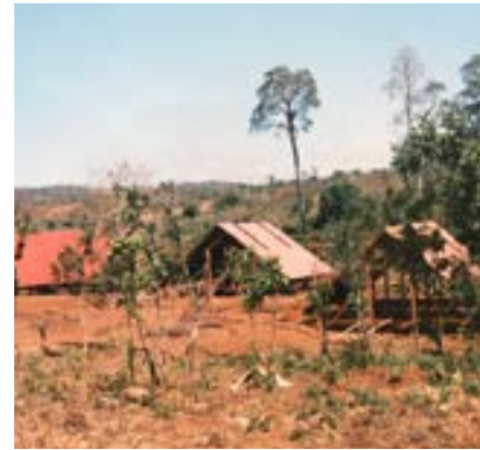
Figures 16 et 17 Habitat traditionnel, Mondul Kiri 17 Construction, Mondul Kiri, 1998

MDK , Mondul Kiri, et Preah Vihear (FBDLS) seront les derniers villages construits, Prey Chum et Smong les derniers foyers ouverts, grâce à de nombreux partenaires dont notamment l'UNESCO, La Halle.