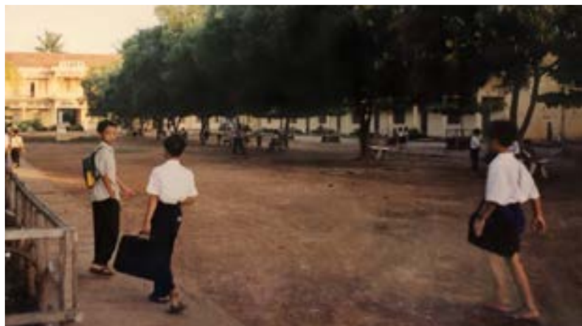
Figure 1 École de Chey Chun Neas