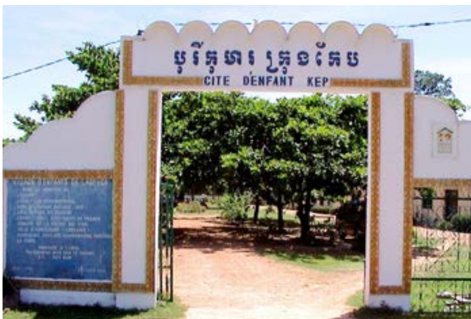
Figures 31, 32 et 33 Constructions de maisons, KEP