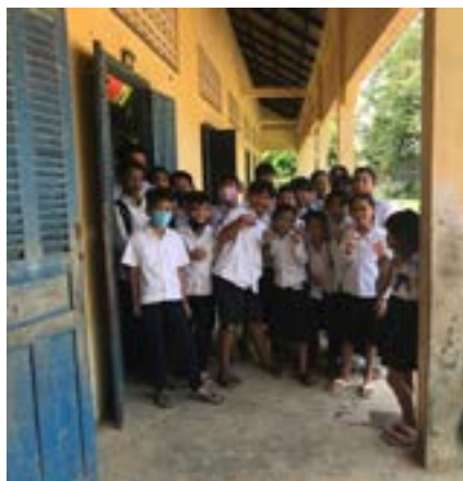
Figure 63 SMONG

En mai 2022, une mission Santé menée par une infirmière et une pharmacienne bénévoles dans trois centres aboutit à un rapport et à l'élaboration d'un plan d'action incluant ateliers, sensibilisation et acquisition de matériel. En juin, des étudiants de l'ESC Rouen rénovent des salles et organisent un spectacle artistique avec les enfants. En août, une mission à Mondulkiri permet d'instaurer un petit déjeuner copieux et équilibré pour tous les enfants de l'orphelinat d'État. En décembre, la Fondation Artelia finance la rénovation de la façade de Borey Komar et d'une salle, tandis qu'à Smong, l'enseignement de l'anglais est renforcé avec quatre heures de cours hebdomadaires. Par ailleurs, le vice-gouverneur de la province de Battambang, ancien filleul, soutient l'association par un don dans le contexte de la pandémie de Covid-19.