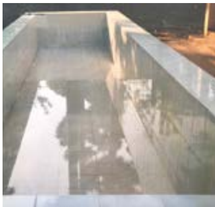
Figure10 Kompong Chnang, bassin restauré, 2003