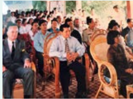
Figure 36 Son Altesse Royale la Princesse Bopha Devi

À Battambang, PHARE PONLEU SELPAK, école de formation aux arts graphiques, arts du cirque, danse, etc... collaborera plusieurs années avec ASPECA, puis avec Enfants d'Asie-ASPECA.