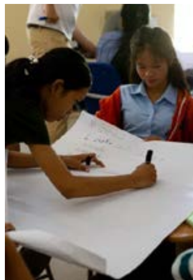
Figures 49, 50 et 51 Atelier d'insertion professionnelle BN

Enfants d'Asie a renforcé et développé également ses programmes pour les externes , c'est-à-dire des enfants vivant dans leurs familles.