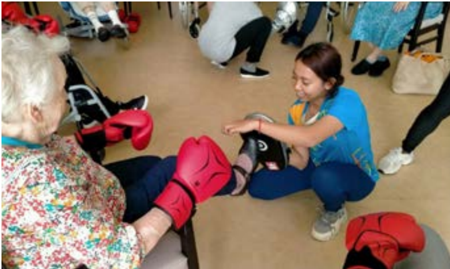
Figure 66 Etudiante cambodgienne en service civique en France

Deux étudiantes de Borey Niseth, francophones et passionnées de sport, sont sélectionnées par France Volontaires et l’Ambassade de France pour effectuer un Service civique en France en 2024 dans le cadre du programme « Terre des Jeux ». Elles s’engageront également comme bénévoles aux Jeux Olympiques de Paris.