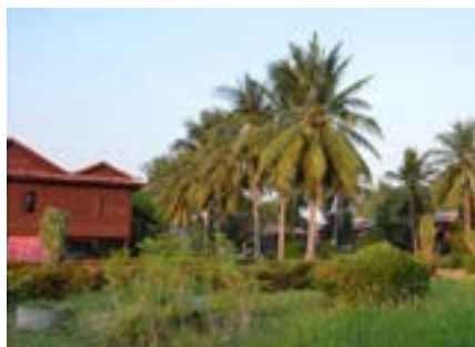
Figure 13 Battambang