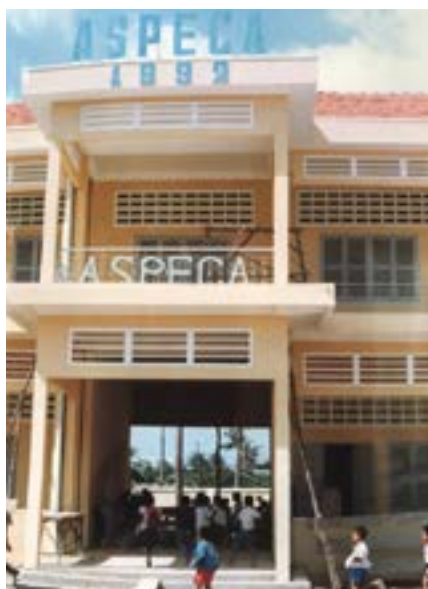
Figures 2 et 3 Première implantation d'Aspeca au Cambodge, Construction d'une salle polyvalente et de 9 salles de classe, CCN

Le parrainage a débuté en août 1989 avec Médecins du Monde, quand les ONG ont pu enfin entrer dans les orphelinats et les écoles. Ces lieux abritaient alors un grand nombre d'orphelins et d'enfants dont les familles, décimées ou dispersées, ne pouvaient plus s'occuper, ils étaient alors des filleuls « internes ». Quant aux écoles, malgré leur état de délabrement, le manque de matériel et d'enseignants, elles continuaient à accueillir les enfants de familles en grande souffrance, qui avaient besoin de soutien. Les enfants devenaient ainsi des filleuls « externes ».