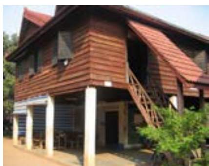
Figure 14 Battambang Village