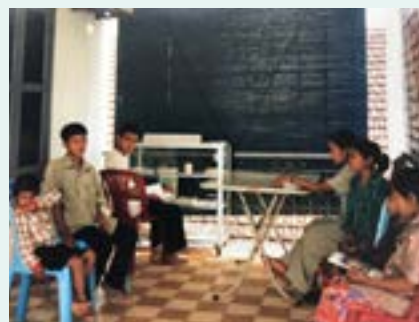
Figures 11 et 12 Cabinet dentaire, salle d'attente, bureau central, 1999