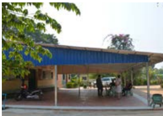
Figures 59 et 60 Smong, locaux, 2019