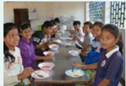
Figures 56, 57 et 58 Cuisine et déjeuner, Bibliothèque Smong 2019

Les besoins en personnel de ces casinos, constituent une aubaine pour les jeunes cambodgiens, à ceci près que les emplois proposés ne sont ni qualifiés ni durables.