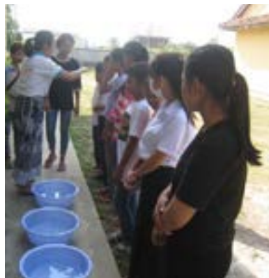
Figures 53 et 54 Hygiène des mains et des ongles, Kandal, 2020