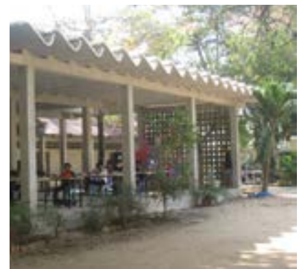
Figure 46 Réfectoire, BK 2020