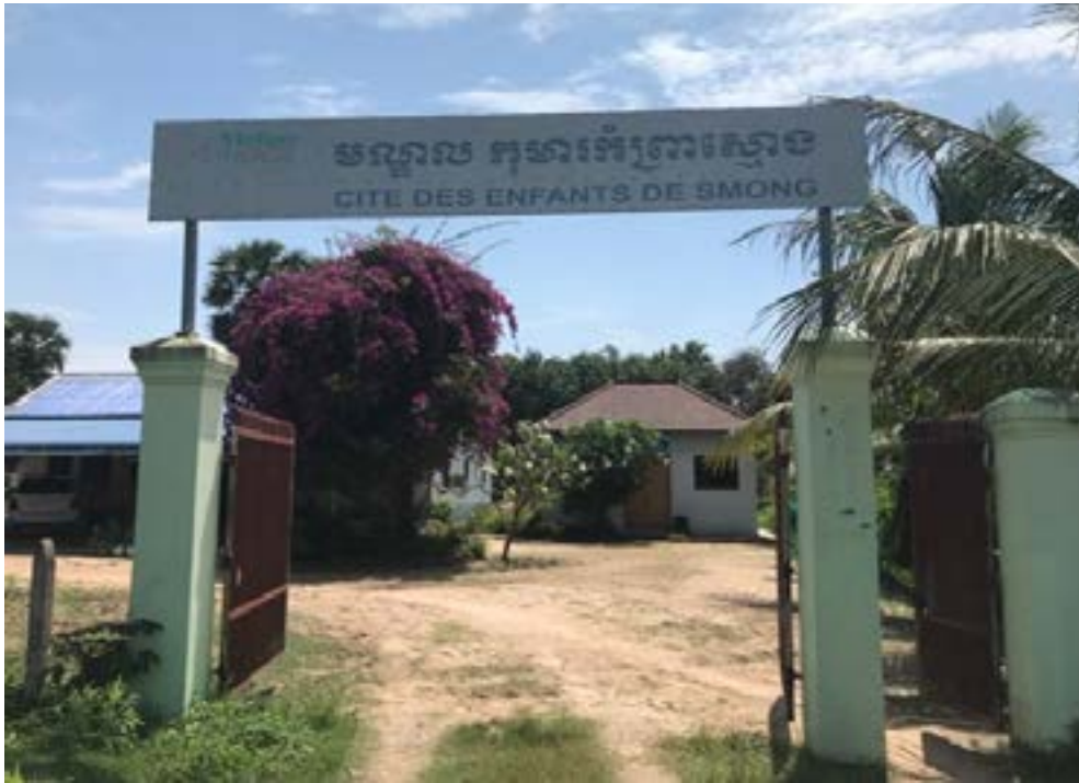
Figure 62 SMONG