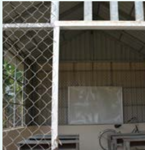
Figure 55 Smong et salle de cours

Les familles sont rencontrées par les travailleurs sociaux, afin d'évaluer leurs situations et celles de leurs enfants et effectuer des enquêtes sociales.