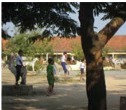
Figure 52 École de Kandal, 2020

En plus des externes déjà soutenus, ces programmes ont vu le jour dans la région de Kandal, ainsi qu'aux alentours du centre de Smong.