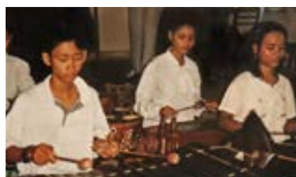
Figures 29 et 30 Université Royale des Beaux-Arts, PP