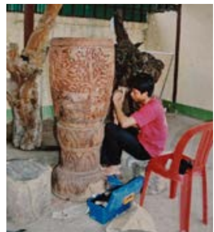
Figures 18 et 19 Atelier bois