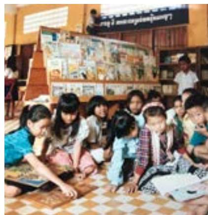
Figure 28 Bibliothèque offerte par le Conseil Régional Lorraine, 1993, CCN, Phnom Penh

Les autorités cambodgiennes étant très sensibles à la « survie » des arts traditionnels, des groupes de jeunes danseurs et musiciens ont été créés dans les centres, certains groupes pouvaient être invités à danser lors de cérémonies internes, mais aussi avec leurs professeurs dans des hôtels autour de certains centres comme KEP, SR, SHV. Les costumes et les instruments de musique étaient financés grâce à des dons.