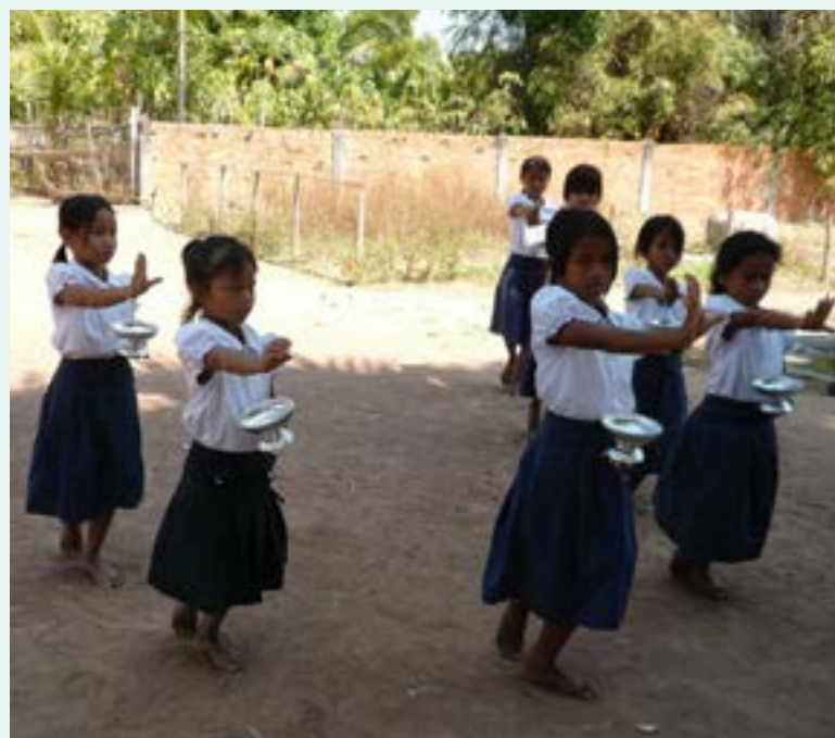
Figure 37 présente pour la pose de la 1 o pierre de l'École des Arts de Siem Reap