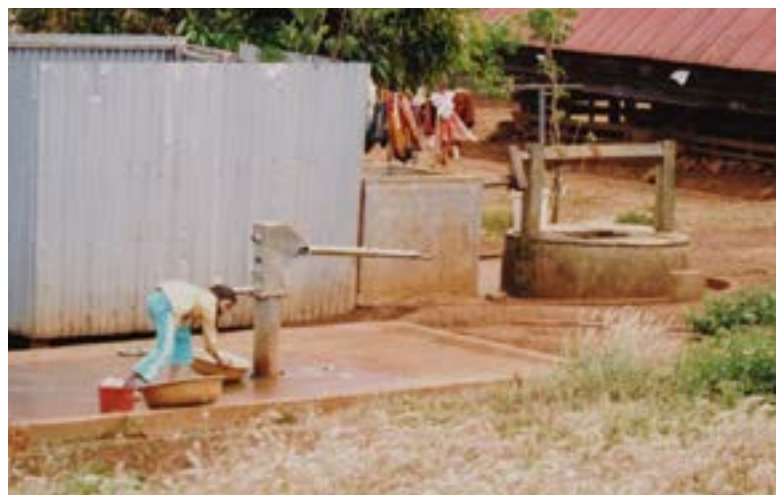
Figure 20 Construction de puits et pompe

La Caisse des Dépôts et Consignations contribuera à la mise en place de potagers à Pailin, l'Association du lycée agricole du Mans installera des serres dans plusieurs centres (WI, Phnom Penh Thmey, KCH, Kompong Cham, etc) et AGRISUD apportera sa contribution également en collaboration avec asso ASASEC.