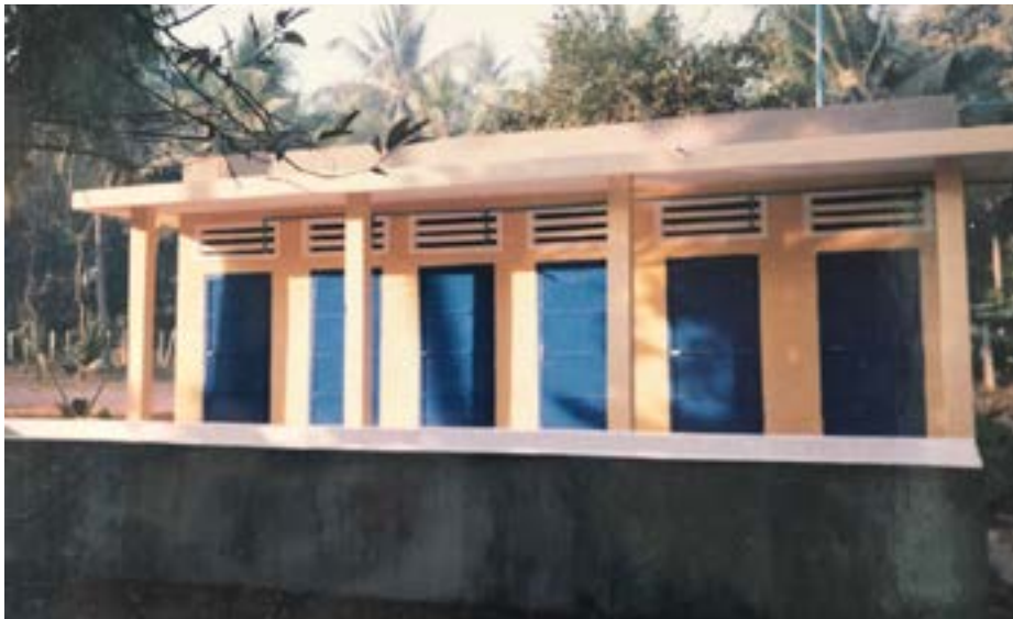
Figure 9 Kompong Chnang, toilettes, 2003