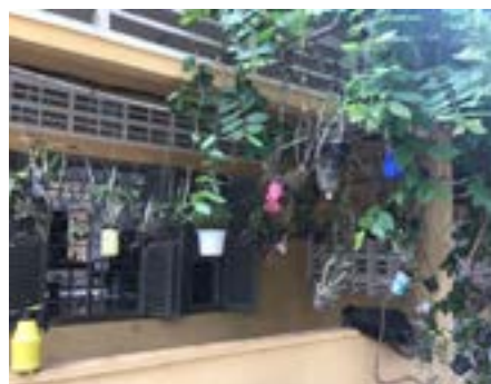
Figures 64 et 65 Borey Komar

Une réflexion est engagée sur l'usage des centres d'hébergement, notamment Borey Komar.