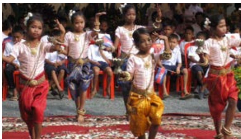
Figure 34 Spectacle traditionnel de danse, KPC ( Kampong Chnaing )

Une ONG britannique, GLOBAL VISION, a longtemps soutenu les jeunes artistes peintres de KCH. Leurs tableaux étaient vendus à des visiteurs de passage « au profit du centre » (certains de ces artistes ont été sollicités pour peindre des fresques dans d'autres centres, PUR, CER4, Borey Komar, KPC, etc ...)