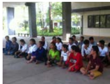
Figures 7 et 8 Enfants à Borey Komar, CER 4 Enfants en formation au centre Don Bosco à Sihanoukville