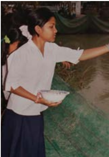
Figures 21, 22 et 23 Etang et poissons