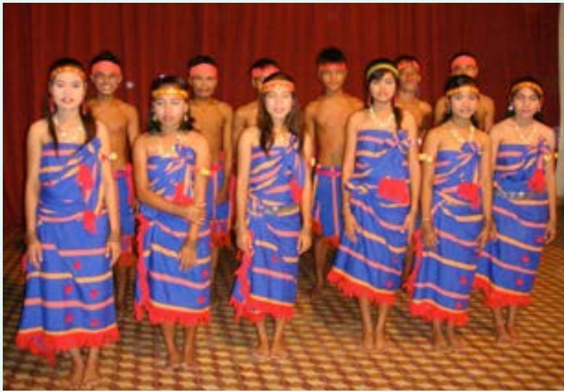
Figure 35 Troupe de danse, Kampong Thom 2009

À Siem Reap, une École des Arts sera créée sur la route des temples qui formera de jeunes danseuses et danseurs avec l'aide du CIAI, (don de Luciano Pavarotti à l'issue de son concert Pavarotti and Friends)