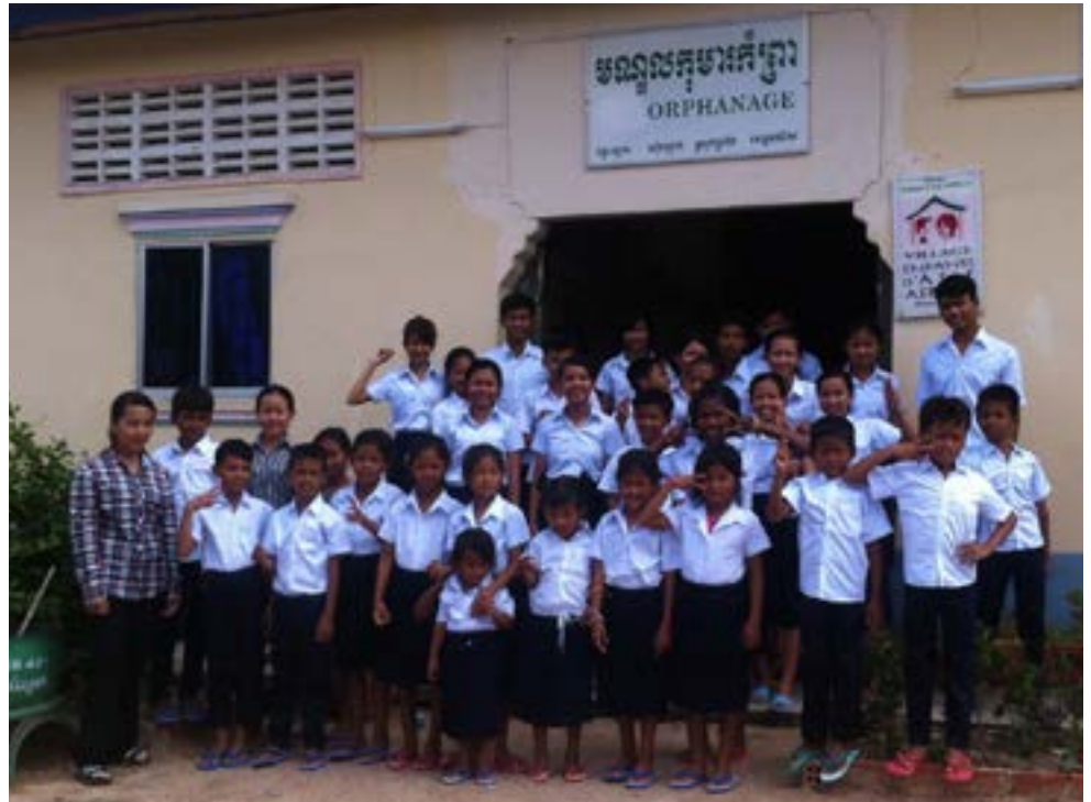
Figure 27 Filleuls d'Enfants d'Asie, Smong