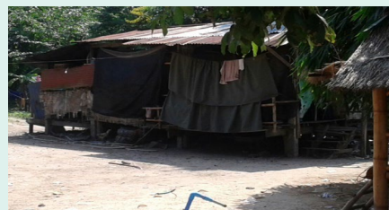
Figure 4 La maison d'un filleul à Boho

Les administrateurs de l'association se rendent régulièrement au Laos, et doivent gérer des relations administratives compliquées.