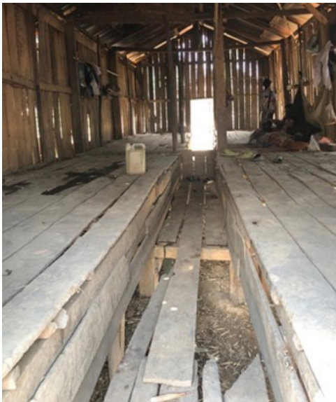
Figures 26 et 27 Dortoir construit villages montagnes région d'Oudomxay (avant/après)