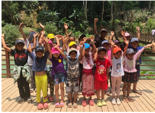
Figures 24 et 25 Sortie pédagogique

Kits dotoirs, vêtements chauds et matériel scolaire sont distribués à de nombreux enfants.