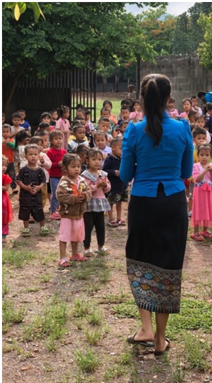
Figure 22 Ecole d'Oudomxay

À Vientiane, une bibliothèque mobile est créée et les enseignants sont formés à des ateliers de lecture pour les enfants. Des activités artistiques (danse, chant) complètent ce dispositif, bénéficiant à 46 enfants, leurs professeurs et des filleuls volontaires. L'association Laoti'EM de l'École de management de Strasbourg finance et organise la distribution de kits scolaires et dortoirs dans les écoles secondaires de Khokha et Namkhong (province d'Oudomxay).