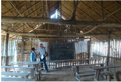
Figures 6 et 7 Classes dans l'état initial