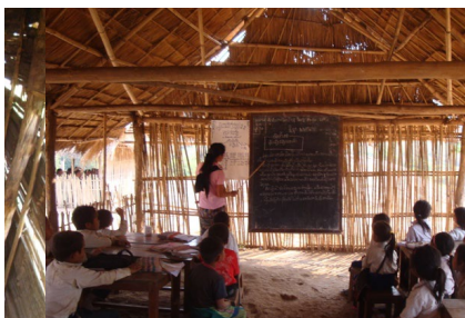
Figure 10 Classe de Mang reconstruite