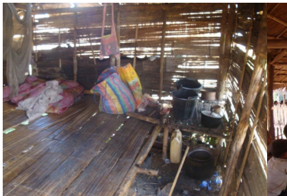
Figures 8 et 9 Dortoir de professeur avant Une classe à Mang