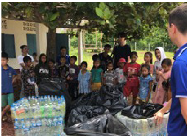
Figure 23 Activités menées par des bénévoles le samedi matin

Une forte inflation nationale accentue la déscolarisation (14 %). Les parrainages se développent, des constructions de bâtiments ont lieu: salle préscolaire à Donexay, bibliothèque à Nong Chong, cuisine partagée à Pakleung, et amélioration de l'adduction d'eau à Navang. Artelia évalue les besoins en eau à Oudomxay.