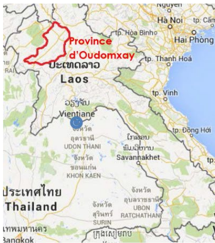
Figure 3 parrainages individuels à Vientiane

Nos écoles dans le nord du Laos, à Oudomxay