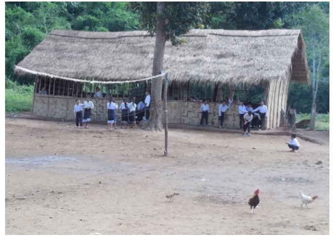
Figures 1 et 2 Dortoir à Namkhong avant Classe à Namkhong avant