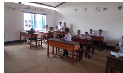
Figures 19 et 20 Classes de Donexay Livraison de matelas et couvertures par Pierre Réfectoire de Namkhong